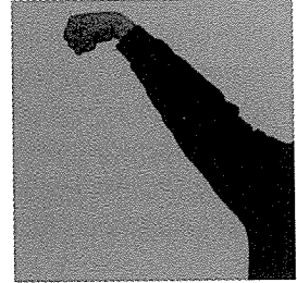
Resim 4 Kollar

Resim 4’de kollar omuzdan dirsekler bükülmeden yukarı kaldırılmıştır. Parmaklar avuç içine alınmış yumruk olarak tutulmuş el bilekleri aşağıya doğru düşürülmüş durumdadır. Bu kol hareketinde Türkiye’nin özellikle kuzey doğu bölgesinde yaşayan Kafkaslardan göçen insan topluluklarına ait oyun türünde görülmektedir.