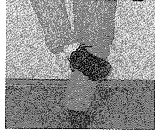
Resim 6 Bacak ve Ayaklar

Resim 6'da bir bacak yerde diğer bacak dizden bükülmüş olarak kaldırılmış ve ayak bileğinin dış yan kısmı içe doğru bükülerek diğer bacağın diz hizasına getirilmiştir. Bu hareketin yapıldığı bölge güney doğu illerinde yaşayan insan topluluklarında ve 'halay' türü oynanan oyunlarda görülmektedir.