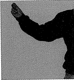
Resim 5 Kollar

Resim 5’de kollar dirsekten bükülmüş olarak el bilekleri omuz hizasına gelecek şekilde kaldırılmaktadır. El parmakları ise ‘parmak şıklatma’ denilen hareketi yapmakta olduğu görülmektedir. Bu kol hareketleri Balkanlar’dan gelen göçmenlerin oynadıkları karşılama türü oyunlarda görülmektedir.