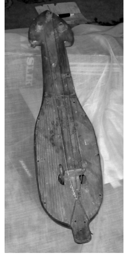
Şekil 4. Kemene örneği (A. Ekinci koleksiyonu)