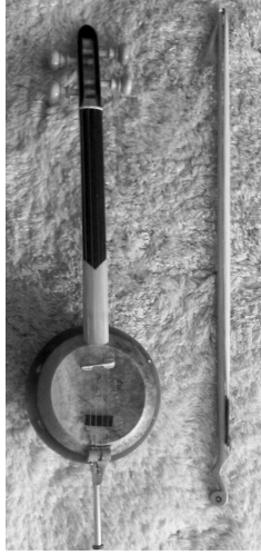
Şekil 2. Kemane (Kadir Verim koleksiyonu)