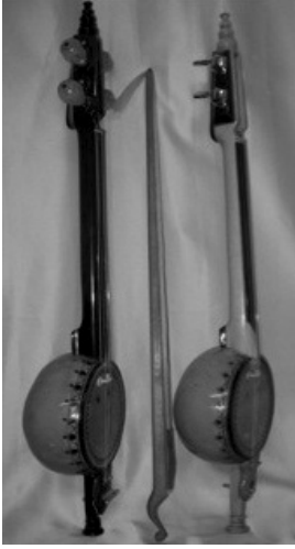
Şekil 1. Kabak kemane (Ekinci koleksiyonu)